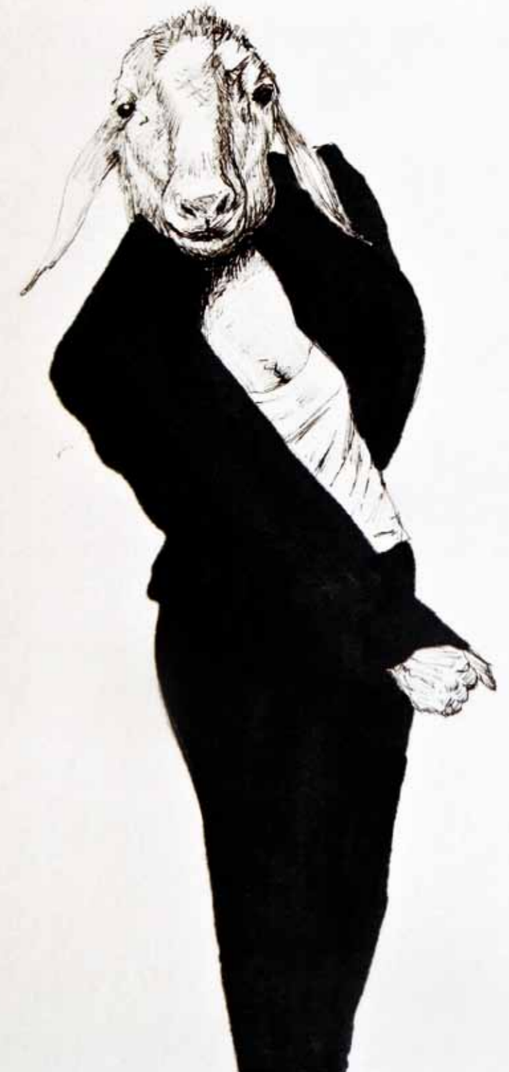
Frauenquote Fineliner, Marker auf Papier, 2011