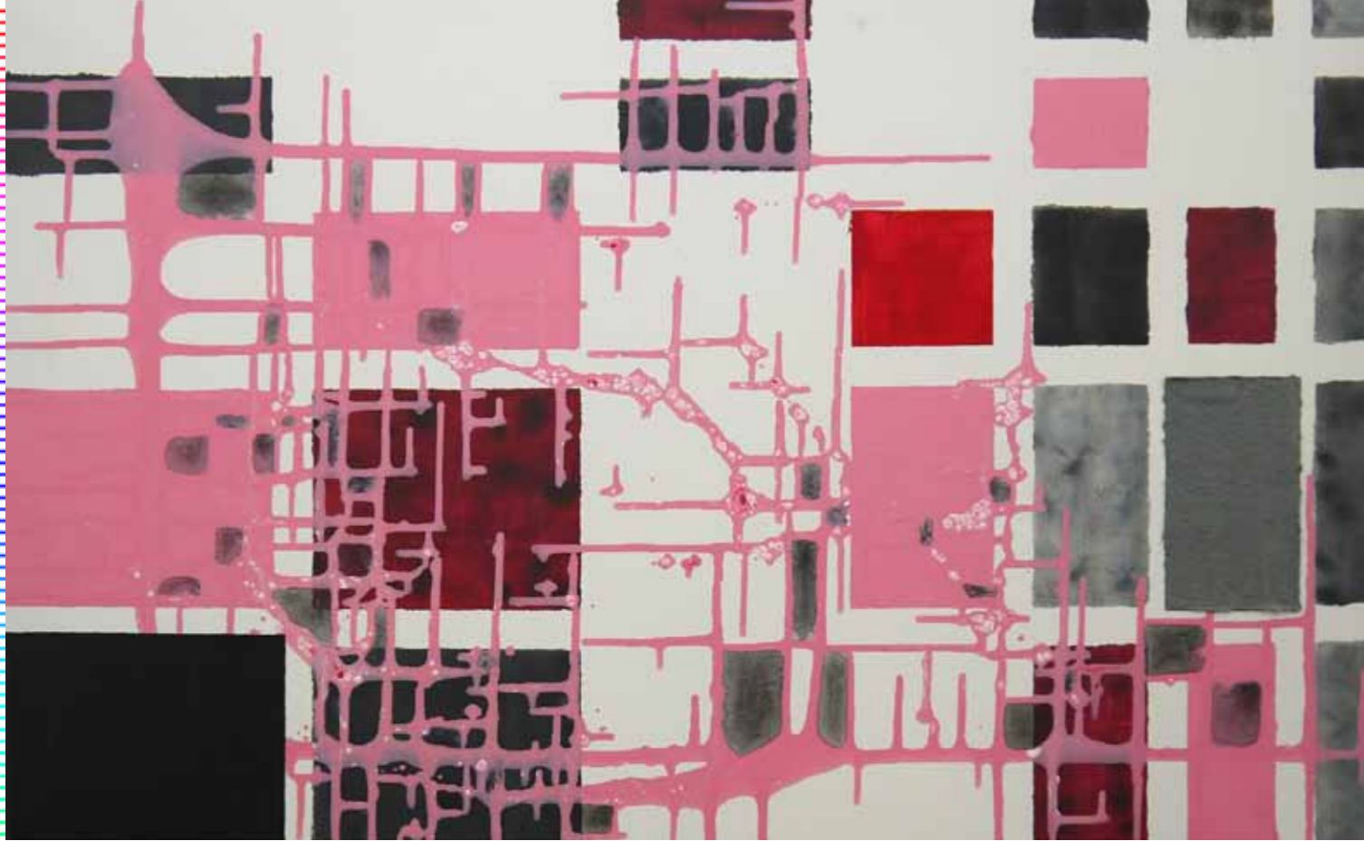
Sonja Schwolgin o.T. 18, 70 x 100 cm, Acryl und Spachtelmasse auf Leinwand, 2012