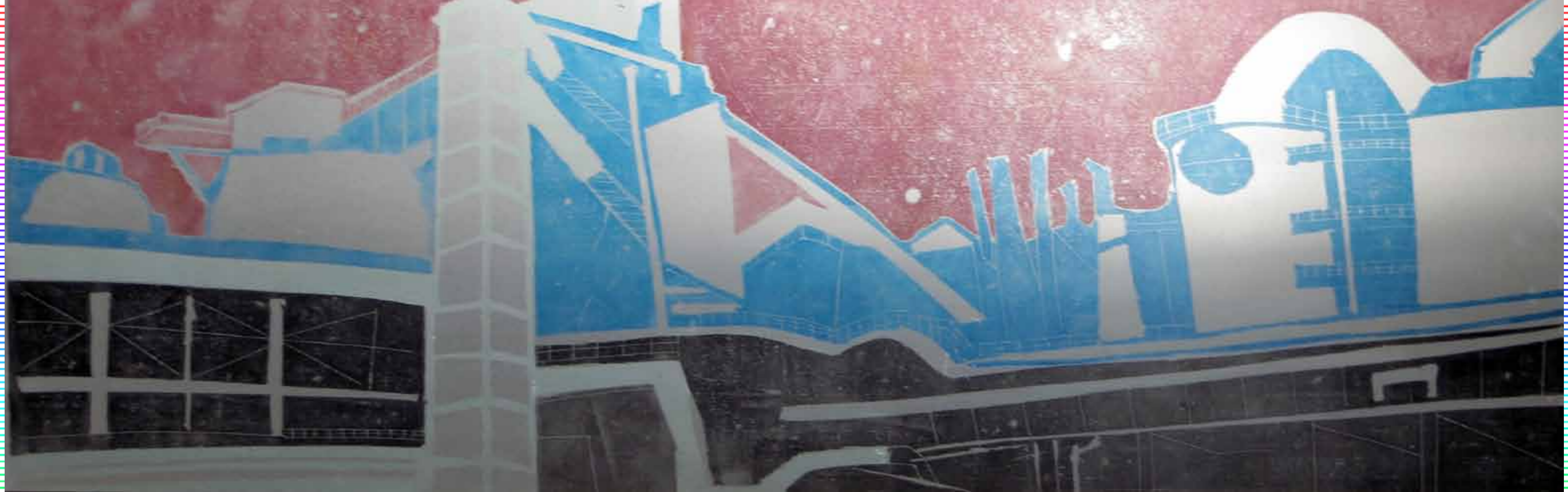
Illumination Mischtechnik: Aluminium, Linol, Polystrol, Offset, 2012